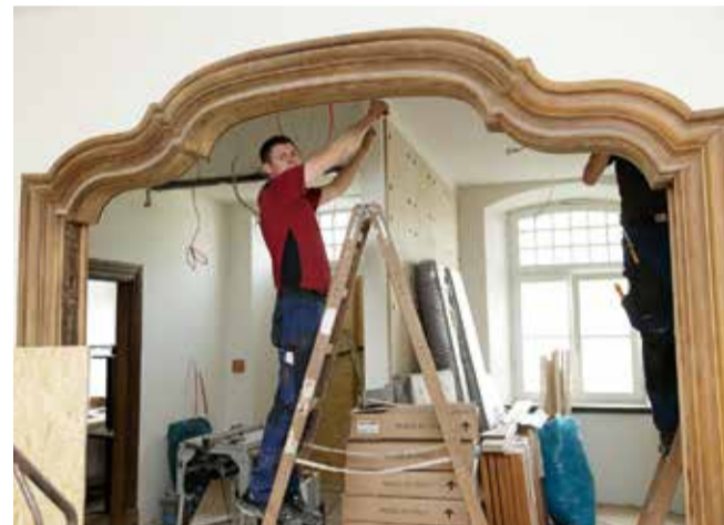
Derzeit sind in dem zukünftigen Hotel noch die Handwerker aktiv, Mitte November soll eröffnet werden.