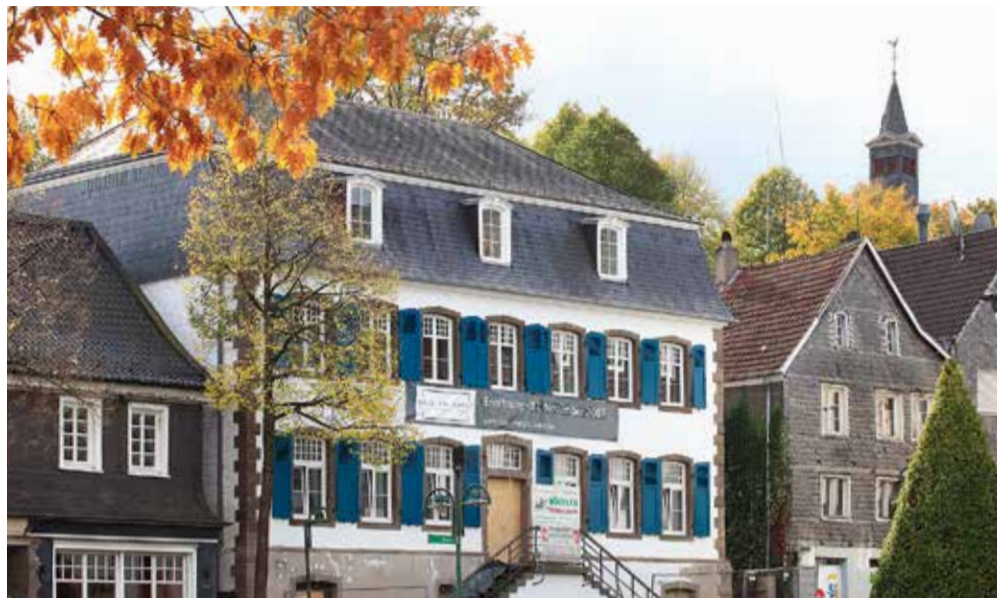
Das große Banner an der Fassade kündigt es an: Aus dem ehemaligen Kolpinghaus wird das „Haus am Markt“, ein Hotel mit Restaurant und Wein-Bar.

Mit dem „Haus am Markt“ bekommt die Wipperfürther Innenstadt ein neues Hotel mit Restaurant und eigener Wein-Bar