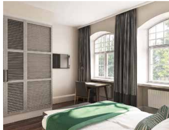
Die Zimmer im „Haus am Markt“ bieten Blick auf den Markt- platz, die Dächer von Wipperfürth oder die Ruhe des Klosterbergs.

Zum Start Mitte November sollen Bar, Restaurant und elf Zimmer fertig sein. Bis Februar wird der Anbau fertiggestellt, dazwischen vermutlich die Tiefgarage. Dann verfügt das „Haus am Markt“ über fünf Einzel- und 24 Doppelzimmer. Darunter auch ein Superior-Zimmer mit einer Badewanne mitten im Raum. Und Wipperfürth hat, neben den bereits vorhandenen Hotels an der Neye, in Wipperfeld, Kreuzberg und Agathaberg, endlich wieder ein Hotel mitten in der Stadt.