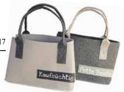
Taschen „mit Aussage“ gibt es im Geschenkhaus Waldmann.