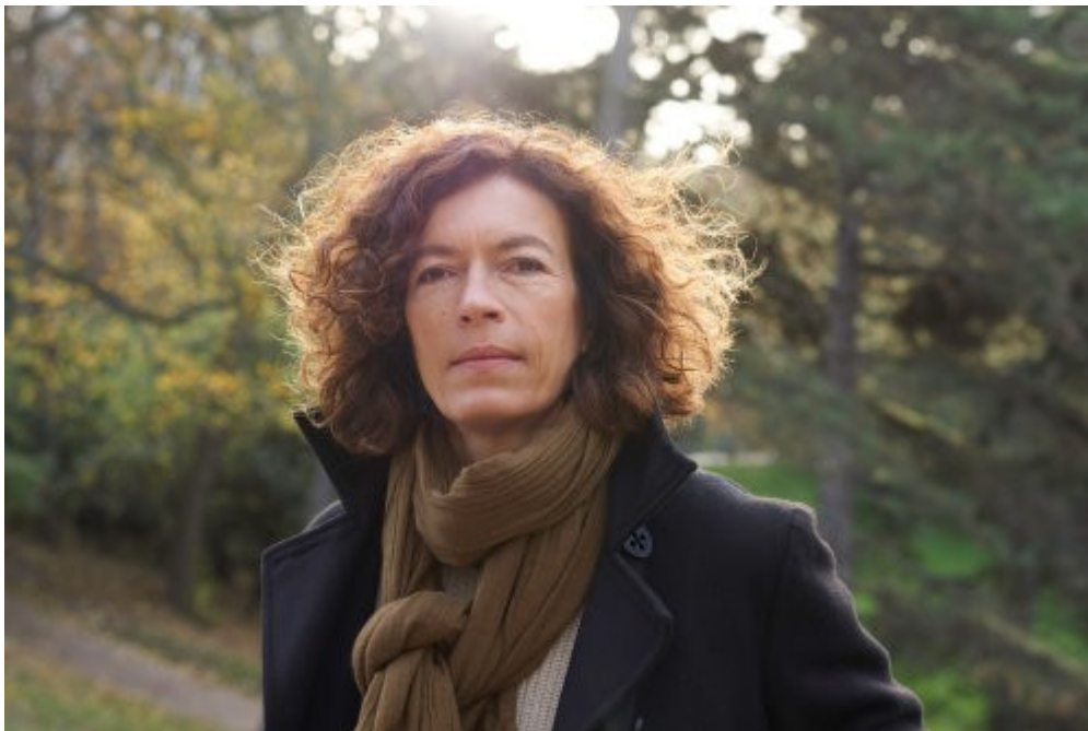
Die Lesung der Autorin Anne Weber gilt als besonderes Highlight der Jubiläumsveranstaltungen